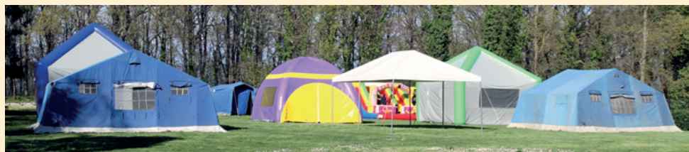
Parte dello "spazio sociale" installato su prato.

I testi completi della normativa e i relativi documenti associativi sono reperibili sul sito dell'Agesci nella sezione Protezione Civile.